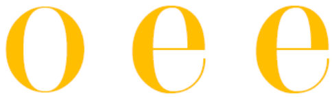
Tableau de Bord de l'Épargne en Europe